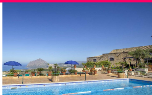
Uno scorcio del Baglio antico www.bagliosantacroce.it

HOTEL BAGLIO SANTACROCE - Valderice 3***sup. scelto per il tuo migliore confort e per la tua Sicurezza