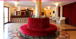
uno scorcio della hall